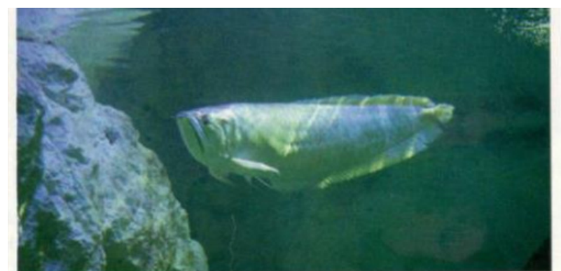
Ernesto est un poisson abandonné mais qui bénéficie d'un parrainage